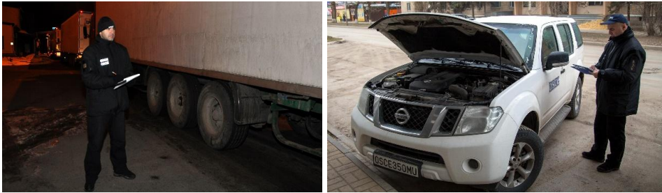
4-5. számú kép Ellenőrzések végrehajtása

a semlegesség fenntartása és a helyi társadalmi-kulturális kontextus befolyásolta. Ugyanakkor az OHM intézményi és szimbolikus jelentősége – a nemzetközi átláthatóság és a tényalapú információ biztosítása – vitathatatlannak maradt, és hozzájárult a konfliktus dinamikájának, a határforgalomnak és a humanitárius helyzetnek a jobb megértéséhez.