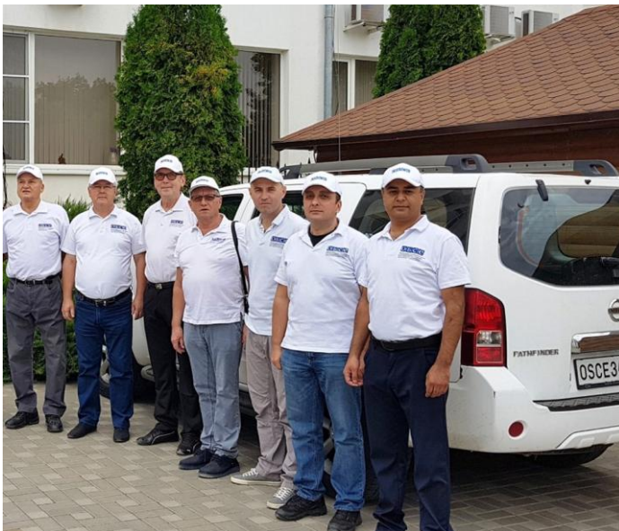
6. számú kép A megfigyelők egy csoportja