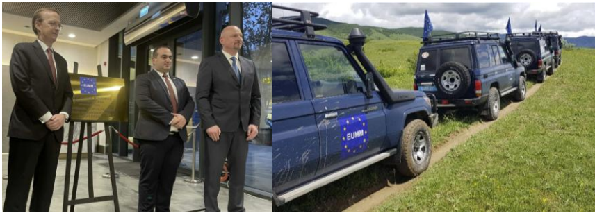
17-18. számú kép

Az évtizedek óta tartó posztkonfliktus-helyzet politikai rendezése továbbra is megoldatlan kérdés.