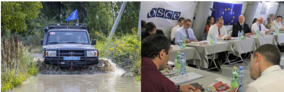
15-16. számú kép

Az EU ezzel főszereplővé lépett elő egy olyan országban, ahol korábban a konfliktushelyzet rendezését előmozdító szereplő az ENSZ és az EBESZ volt. A 2008–2009-es évek stratégiai szintű változást hoztak. A korábbi nemzetközi békefenntartó műveletek beleértve az orosz vezetésű „békefenntartás” időszakát is (1992–2008) lezárultak; egy korszak véget ért. 2009 közepétől az EUMM Georgia az egyetlen olyan, megfigyelői mandátummal és a konfliktuszóna közelébe telepített robosztus képességekkel rendelkező szervezet, amely a mandátum keretein belül észlelt eseményekről valós időben képes jelentést tenni.