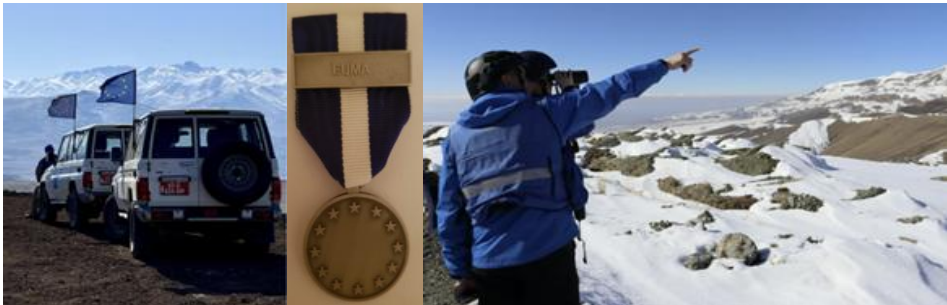
19-20-21. számú kép

A bal és a jobb oldali fényképen az EUMA állománya látható feladatok ellátása közben az örmény–azerbajdzsáni határszakasz örményországi oldalán. 50 A középső fotó a szerző saját felvétele, amelyen az a szolgálati medál látható, amely az EUMA-misszió előkészítő fázisában teljesített szolgálatot ismeri el. A megszokott CSDP-medáltól eltérően a kék-sárga-kék színek helyett a kék-fehér-kék színösszetétel szerepel rajta. Mindössze 82 személy részesült ebben az elismerésben. 51