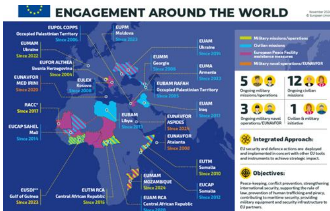
12. számú kép A CSDP-műveletek térképe 35

Jelen cikk célja, hogy a posztszovjet államok területén működő civil EU-missziók bemutatásán keresztül régiós szintű kitekintést nyújtson, felölelve a közelmúlttól napjainkig terjedő időszakot. A szerző csak csekély mértékben vállalkozik arra, hogy távoli idősíkra vonatkozó megállapításokat tegyen; ennek elsődleges oka, hogy a bemutatott műveletek egyik közös jellemzője a biztonságpolitikai helyzet gyors, esetenként nehezen prognosztizálható változása.