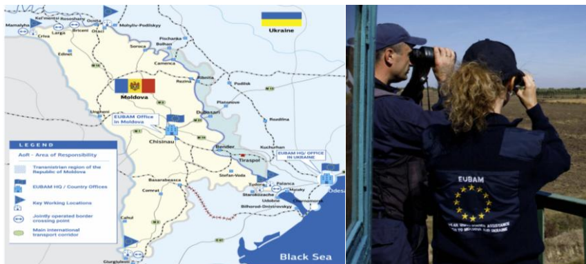
22-23. számú kép A misszió műveleti területe 52 és megfigyelők munka közben 53

A mandátum egyes elemei általában a moldáv–ukrán határszakasz biztonságának fejlesztését célozták meg. Kiemelt elem volt az államhatáron átnyúló csempészet, korrupció visszaszorítása, az EU-standardok szerinti határigazgatás támogatása, különösen az integrált határrendészet kiépítése. A misszió állománya elsősorban tanácsadói és koordinációs feladatokat látott el a határellenőrzés és a vámigazgatás teljes spektrumában, beleértve a kapacitásfejlesztéseket is. A nemzetközi személyi állományt az EU-tagállamok biztosították, jellemzően 100-140 fő volt a teljes keret (helyi alkalmazottakkal együtt). A folyamatos magyar rendészeti részvétel mellett ki kell emelni, hogy a misszió első vezetője (Head of Mission) dr. Bánfi Ferenc r. dandártábornok volt.