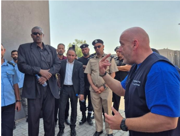
26. számú kép

Feladatmegbeszélés a gyakorlati képzés közben a Líbiai Vámigazgatási Hatóság és a Kábítószerbűnözés Elleni Igazgatóság tisztjeivel 2025. augusztus 21-én, Tripoliban.