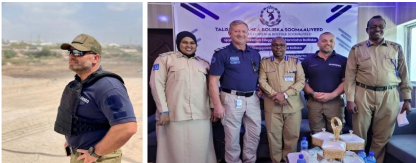
31-32. számú kép A Darwish kiképzőtáborban és megbeszélés után a somáliai rendőrség vezetőivel