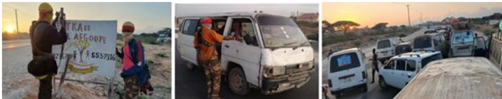
34. számú kép Al-Shabaab ellenőrzőpontok Mogadishu környékén

pontokat állítottak fel, és több, stratégiaileg igen fontos, Mogadishuba vezető hidat tartottak ellenőrzésük alatt. Az országban, de különösen Mogadishuban kezdett eluralkodni a pánik. A különböző sajtóhírek, a helyi és nemzetközi biztonsági elemzések végletesen széles skálán mozogtak, az „igazából minden rendben” és a „holnap elbukik a kormány és Mogadishu” között.