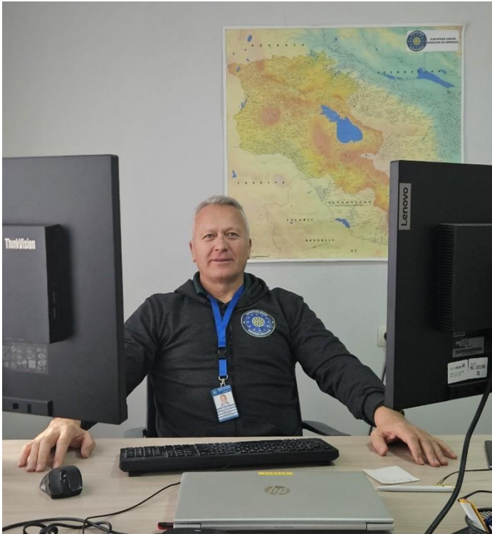
39. számú kép A tanulmány szerzője munka közben