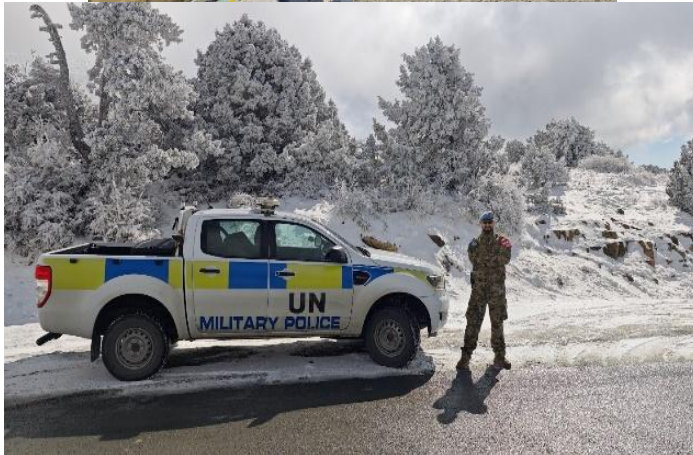
47. számú kép a tanulmány szerzője munka közben