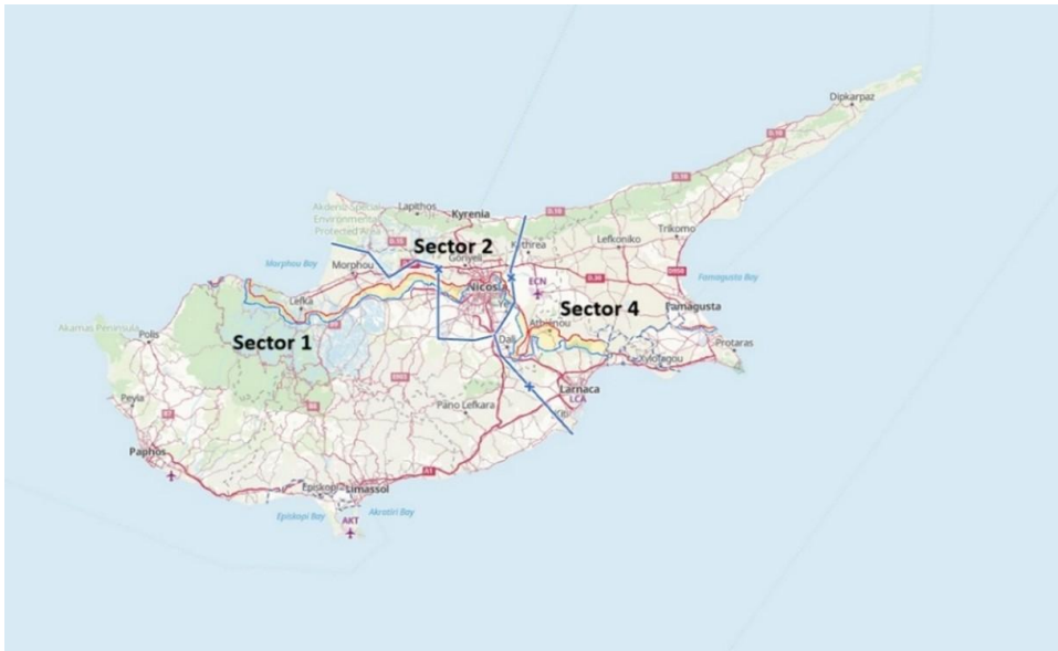
46. számú kép Ciprus térképe az UNFICYP-szektorhatárokkal

Az UNFICYP-misszió három műveleti területre oszlik. Az argentin kontingens által felügyelt 1. szektor központja a Skouriotissa település melletti San Martin Camp, a brit kontingens által felügyelt 2. szektor központja Nicosiában, az egykor patinás szálloda területén, a Ledra Palace Hotelben található, és a 4-es szektor – amelyet a szlovák kontingens felügyel – központja, a Camp General Stefanik Famagusta városában található. A 3-as szektor megszűnt, amikor 1993-ban a kanadai kontingens kivonult, és feladataikat a 2-es és a 4-es szektorok vették át.