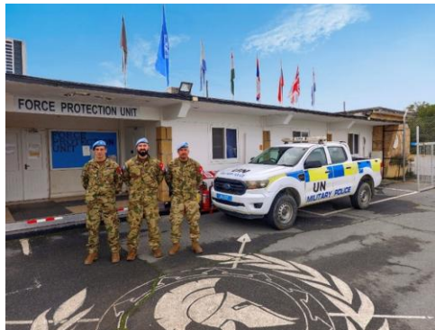
47. számú kép

Mindezek alapján elmondható, hogy az FMPU a „klasszikus” értelemben vett katonai rendészeti feladatokat látja el, amely legfőbb eleme a misszió állományán belül a rend, fegyelem, törvényesség fenntartása a misszió teljes területén, mindemellett a bűncselekmények megelőzése, felderítése, szükség esetén a nyomozati cselekmények lefolytatása, továbbá a görög-ciprióta és a török-ciprióta rendőri társszervekkel való kapcsolattartás. Az FPU az egyetlen egység a misszióban, amely állandó fegyverviselésre jogosult.