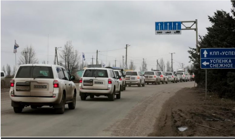
35. számú kép

2022. március 1. Az EBESZ Különleges Megfigyelő Misszió megfigyelői elhagyják a Donyecki szakadár államalakulatot Oroszország, a Don menti Rosztov felé 3