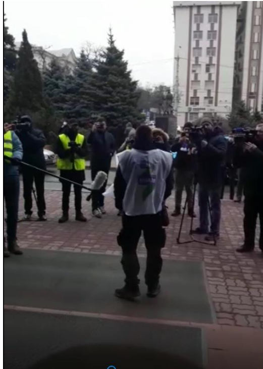
36. számú kép EBESZ ellenes demonstráció Rosztovban 2022. március 2-án 4

Március 2-án 17.00 órakor a megfigyelők Rosztovból busszal utaztak tovább Szocsiba, ahonnan március 3-án Isztambulba repültek. Március 3–6. között minden megfigyelő hazatért Isztambulból, a misszió pedig hivatalosan bejelentette, hogy minden nemzetközi megfigyelő biztonságban van és elhagyta Ukrajnát. A misszió felsővezetése március 7-én hagyta el Kijevet.