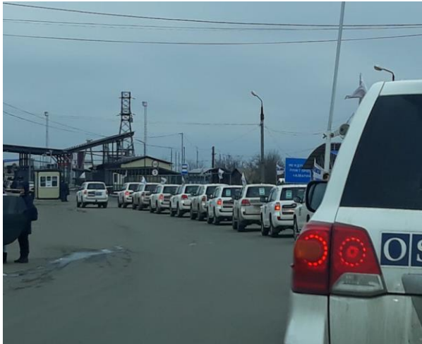
34. számú kép